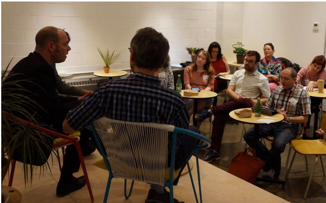
Événement professionnel "6 à 8 de la CBPQ - Table-ronde sur les tendances et innovations en bibliothèques universitaires françaises et québécoise" - Mai 2016

Corporation of Professional Librarians of Quebec